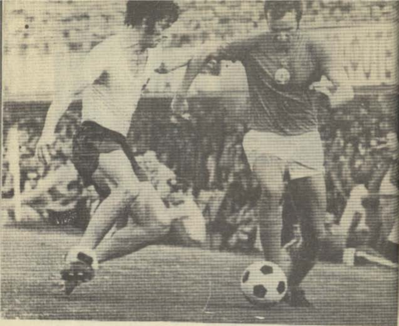
Из срещата ЦСКА — ЕТЪР