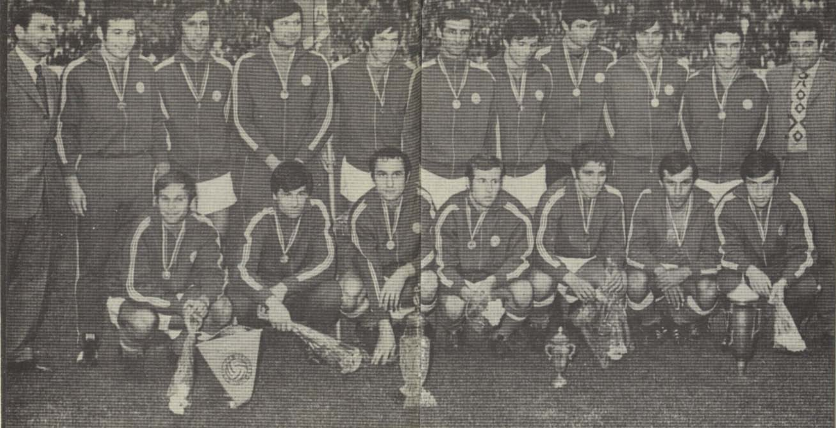
Републикански първенец — 1973 г.