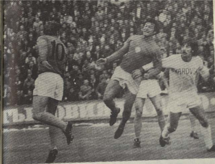
Из двубоя ЦСКА — ВАКЕР