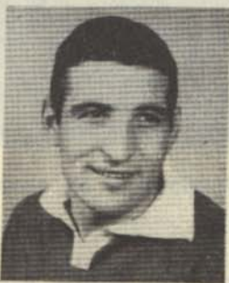
Капитана на отбора

шия клуб и името на българския футбол. "Байерн" има силни страни в играта си, но и нашите не са малко. Всички си даваме сметка, че ни очаква сериозна битка на 20 март. Имам чувството, че срещата като че ли поиска да изпита докрай силата на ЦСКА... Както крилето в полета заякват, така и големите футболни отбори в големите битки се каллят и утвърждават... Аз съм уверен в силите на състезателите и очаквам да излезем с чест от мача с "Байерн" на 20 март.